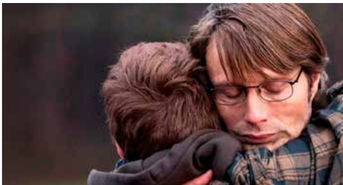
Scene fra filmen Jagten