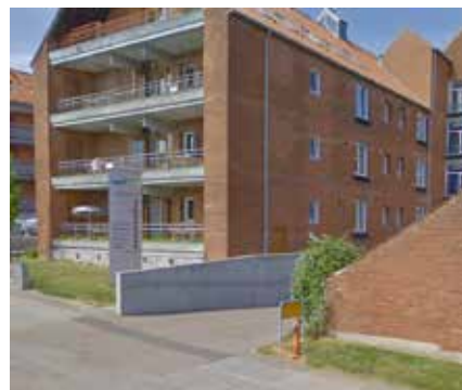
Lokalcenter Fuglebakken.